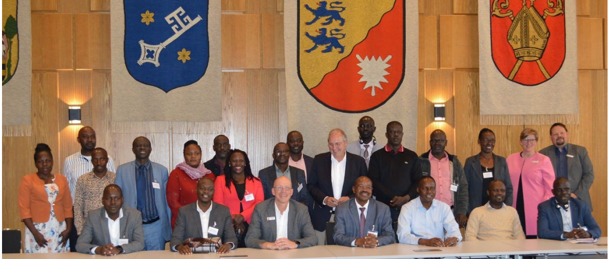
BU: Landrat Dr. Rolf-Oliver Schwemer (vorn, Mitte) mit Honorable Amos Lugolobi (vorn, rechts vom Landrat), Staatsminister für Planung und Finanzen der Republik Uganda und seine Delegation im Kreishaus Rendsburg-Eckernförde.