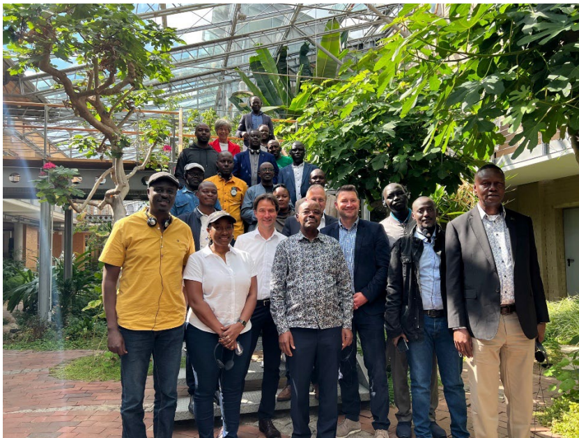
BU: Honorable Amos Lugolobi, Staatsminister für Planung und Finanzen der Republik Uganda (vorn, Mitte) und seine Delegation mit Thorsten Liliental (TÖZ) und Kai Lass (WFG), beide stehen hinter dem Minister (v.l.n.r.) im Technik- und Ökologiezentrum Eckernförde.